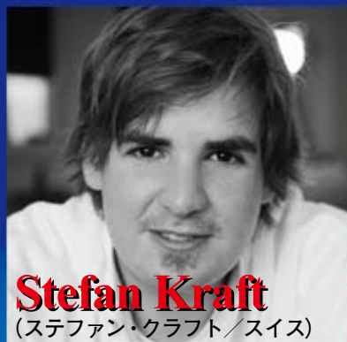
Stefan Kraft (ステファン・クラフト/スイス)